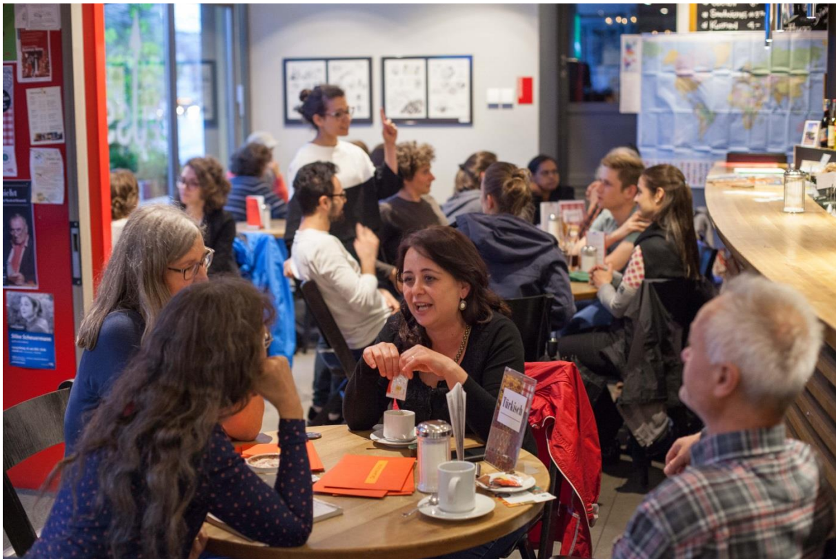
Regelr Austausch unter den sprachenbegeisterten Besuchern im «Bistro International»

Im Bistro hat sich die Gästefrequenz über Mittag auf einem hohen Niveau stabil eingependelt. Ruhigere Abende konnten mit Veranstaltungen wie «Bistro International» oder «Comic Labor» belebt werden.