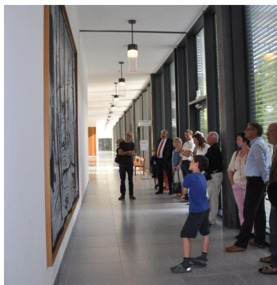
Kurzführungen im Rahmen der Vernissage «Kunst im Superblock»